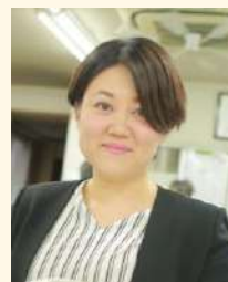
株式会社グリーンズ 人財戦略室 室長