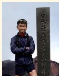
観光庁観光産業課 国際観光振興政策企画官