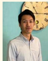
株式会社グリーンズ チョイスホテルズ西日本営業部 福岡沖縄エリア